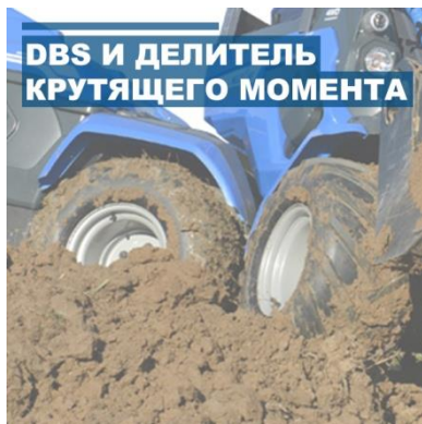
DVS И ДЕЛИТЕЛЬ КРУТЯЩЕГО МОМЕНТА